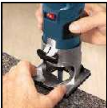
Frezare canturi lamine