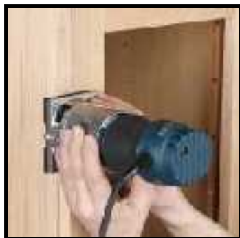
Frezare canturi pentru mobilă deja montată

Manevrabilitate excelentă și versatilitate pentru o multitudine de aplicații!